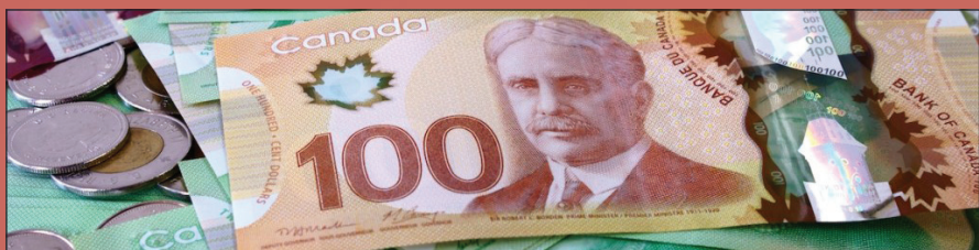
Canadian dollar strengthens as oil prices rally.