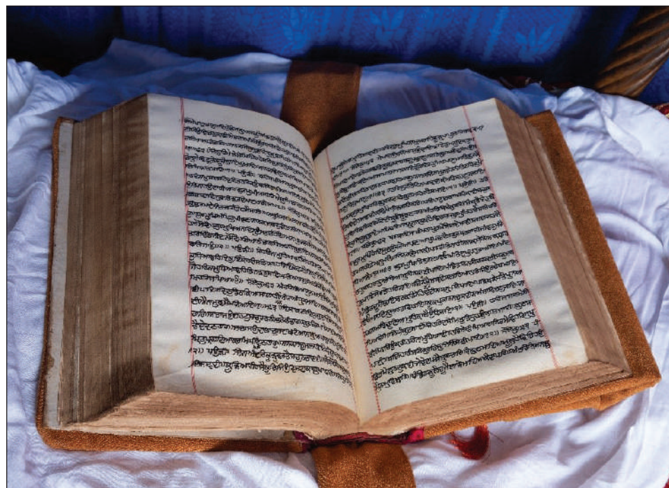
Handwritten Saroop of Guru Granth Sahib at Guru Nanak Math, Balaju, Kathmandu, Nepal

Very impressed by the lofty teachings of Guru Nanak, Nepal's King Jay Jagat Malla had granted 1600 Ropanis (200 Acres) of land to the Guru. A later king, Rana Bahadur Shah, had also gifted considerable land to the shrine after finding solace for his "unsound mind" at the Math. Fortunately, the official records pertaining the donations of land to Guru Nanak are still preserved by